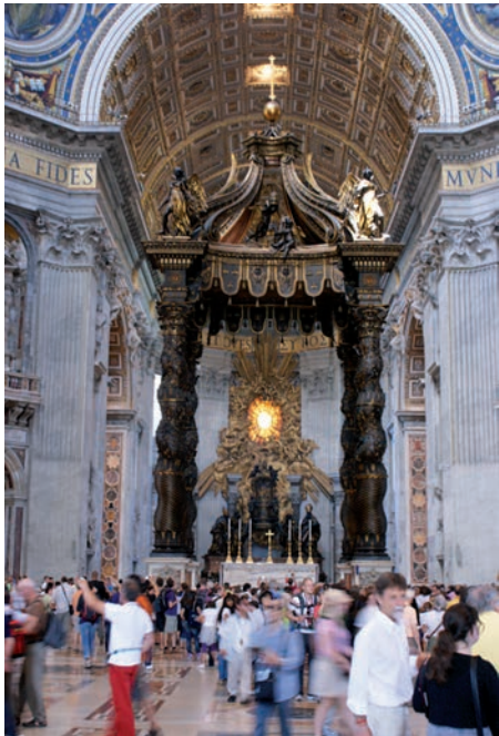
Auch der Petersdom wurde besucht.

Einsam waren wir auch am folgenden Tag nicht, dem Barock-Tag, im Vatikan. Hier hatten wir nun das Glück, die Massen auf dem Petersplatz zu umgehen, indem wir von einem netten jungen Offizier der Schweizer Garde empfangen wurden. Er zeigte und erklärte uns zunächst die Kaserne und die Übungs- und Waffenkammer und geleitete uns dann auf besonderem Wege durch die nicht öffentlich zugänglichen Gänge in den Petersdom. Beeindruckend, wie der Dom selber mit all seinen fast überdimensioniert wirkenden Kunstschätzen und (kirchen) geschichtlichen Ereignissen!