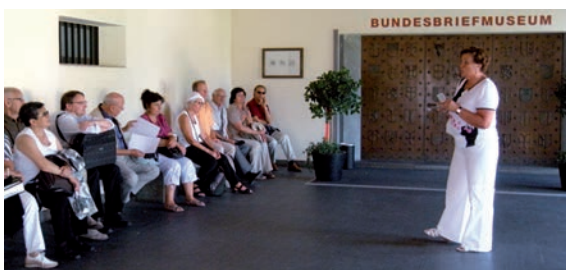
Chormitglieder vor dem Eingang zum Bundesbriefmuseum.

Campo de' Fiori, Villa Borgese, Piazza del Popolo, Santa Maria Maggiore, San Pietro in Vincoli, Campidoglio und Monumento Vittorio Emmanuele II ... diese wohlklingenden Namen mit den dazugehörigen Bildern und Eindrücken zu verbinden, stand auf dem Programm dieses ersten Tages. Allein diese Namen lösten in der einen oder dem anderen romantische Verzückungen aus. Nun ja, zumindest so lange, bis wir der Realität ins Auge schauten und feststellten, dass just an diesem Tag, dem 2. Juni 2011, die 150Jahr-Feier des Bestehens der Italienischen Republik begangen wurde. Mit anderen Worten: Die